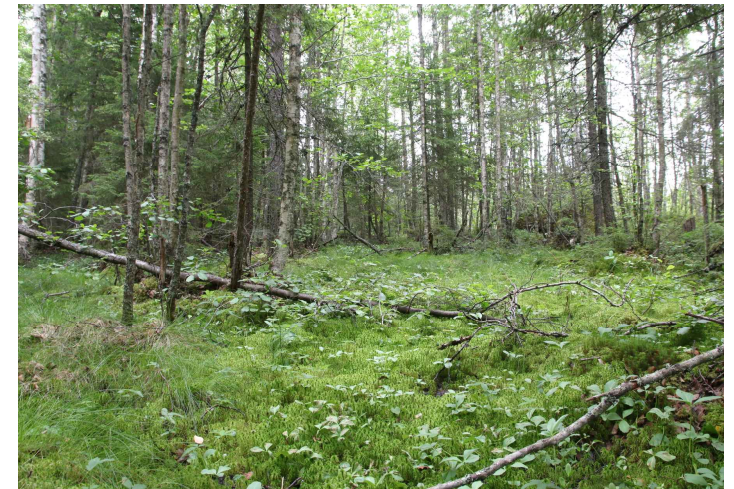
Kuvat: Mari Oja