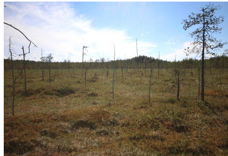
Kuvat: Mari Oja